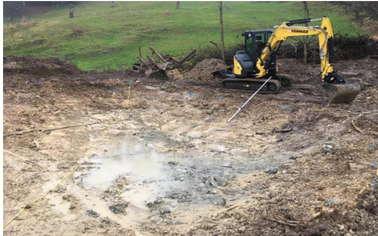
Aushub des Weihersubstrates bis auf das alte Vlies im Dezember 2020.