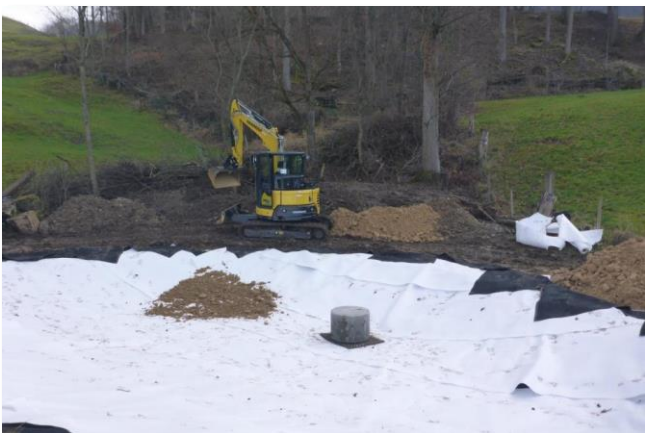
Das Schutzvlies wird auf die Kautschukfolie verlegt.