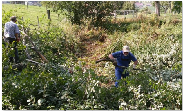
und im September 2020