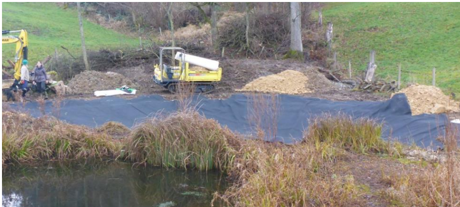
Einbau der Kautschukfolie