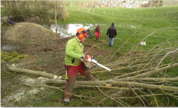
Rodungsarbeiten im März ...