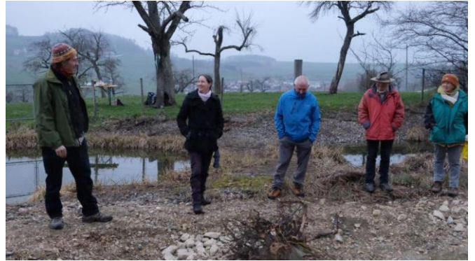
Besichtigung der sanierten Weiheranlage