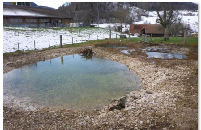
Der fertig sanierte und wieder aufgefüllte Weiher