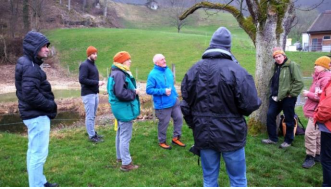
Anstossen mit den Behördenmitgliedern und der ausführenden Firma auf die gelungene Sanierung